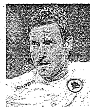
Francesco Totti ATTACCANTE ROMA

Sempre sensibile sul tema di diritti dell'infanzia. Ambasciatore italiano per l'Unicef, si distingue per l'aiuto ai minori in difficoltà.