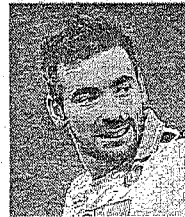
Ezequiel Lavezzi ATTACCANTE NAPOLI

Ha creato un'associazione benefica (Ansur) per i bambini disagiati della zona di Gobernador Galvez, dove è nato il Pocho.