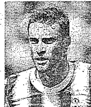
Claudio Marchisio CENTROCAMPISTA JUVENTUS

Sostenitore della fondazione «Crescere insieme al Sant'Anna» grazie alla quale ha portato a termine diversi progetti.