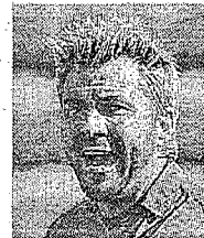
Sebastien Frey PORTIERE GENOA

Emergono la sensibilità e le attenzioni dimostrate nelle diverse iniziative sociali e benefiche organizzate non solo dal club.