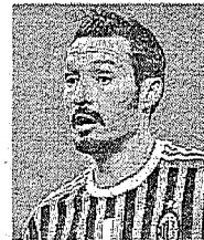
Gianluca Zambrotta DIFENSORE MILAN

Sempre attento alle iniziative benefiche, soprattutto quelle rivolte ai più piccoli. Molto attivo nella sua zona, il Comasco.