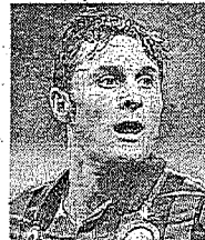
Javier Zanetti DIFENSORE INTER

Da oltre dieci anni attraverso la fondazione «Pupi», da lui fondata e voluta, sostiene i bambini bisognosi dell'Argentina.