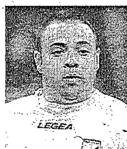
Fabrizio Miccoli ATTACCANTE PALERMO

Impegnato sia in provincia di Palermo sia nel Salento verso i bisognosi e nell'ambito delle attività che riguardano il calcio.