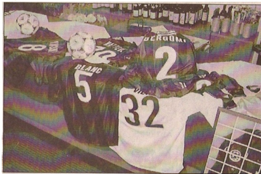
Il piatto forte della serata al Golf club di Carimate: le maglie dei calciatori vendute all'asta