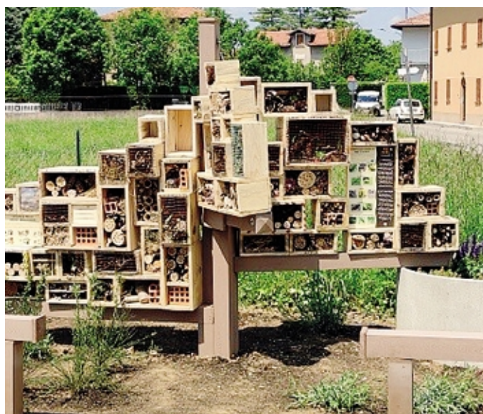
Il bug hotel di Castelnuovo

Nel bug hotel - realizzato nel parcheggio di via Aliverti - in una serie di celle di forma e dimensione variabili è stato ricreato un habitat naturale adatto per le esigenze riproduttive e letargiche di ciascun insetto.